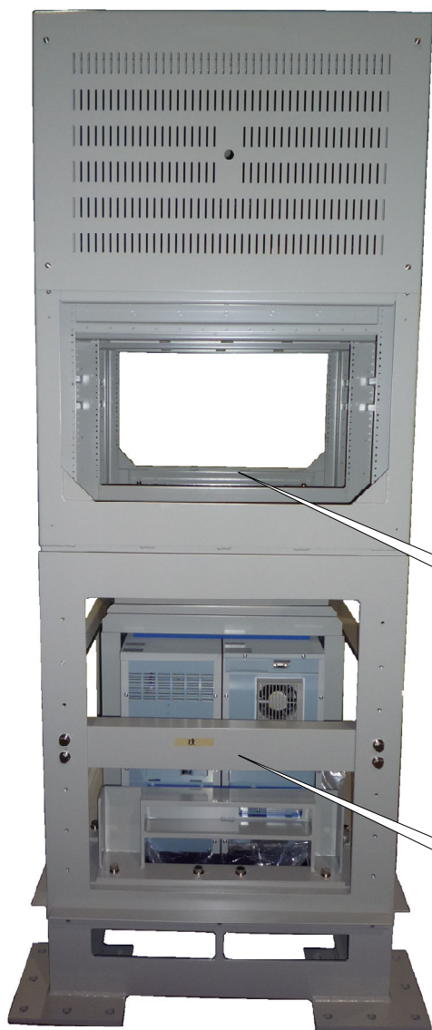
LAN機器收容架写真 (背面)